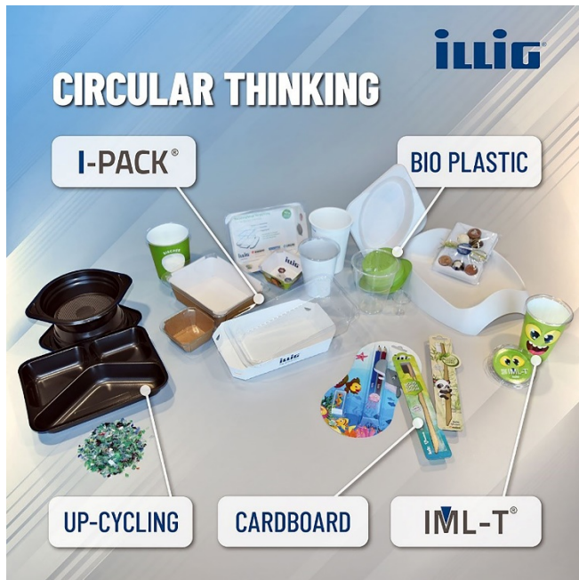
Pic-3: ILLIG präsentiert nachhaltige Lösungen auf der Chinaplas 2021.