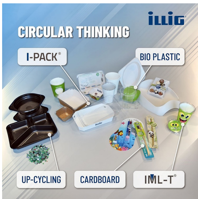
Pic-3: ILLIG 在 2021 年 11 月 11 日 展 出 了 新 热 成 型 系 统 。