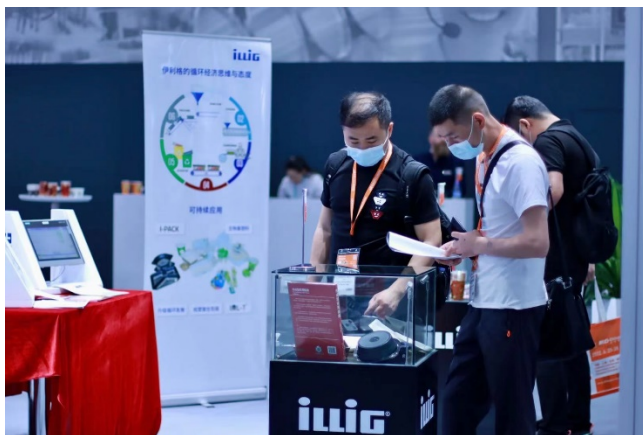
Pic-5: Die Fachbesucher der Chinaplas 2021 zeigen großes Interesse an ILLIG's nachhaltigen Lösungen.