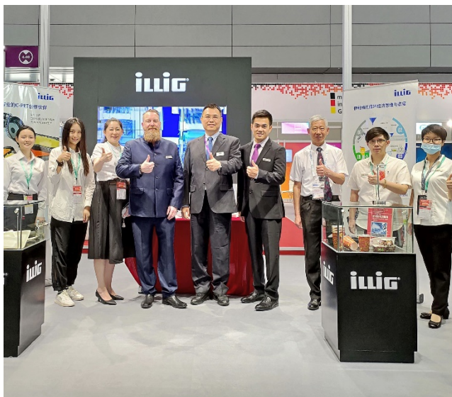
Pic-1: Großer Erfolg für ILLIG auf der Chinaplas 2021: Das Team vor Ort.

Hinweise: Mit ® gekennzeichnete Begriffe sind eingetragene und geschützte Marken der ILLIG Maschinenbau GmbH & Co. KG.