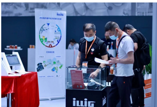
Pic-5 : 图 5 展示了 2021 年国际橡塑展 (Chinaplas 2021) 的现场情况，展示了 ILLIG 集团的产品展示。