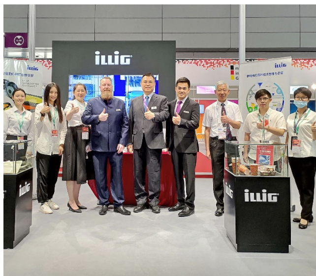
ILLIG 2021 年 11 月 11 日 在 中 国 上 海 举 行 的 第 一 届 中 国 塑 料 展 览 会 上 展 出 了 新 热 成 型 系 统 。