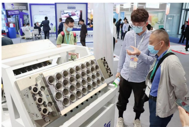
图 4: ILLIG 集团在中国推出 RedLine 新热成型系统。