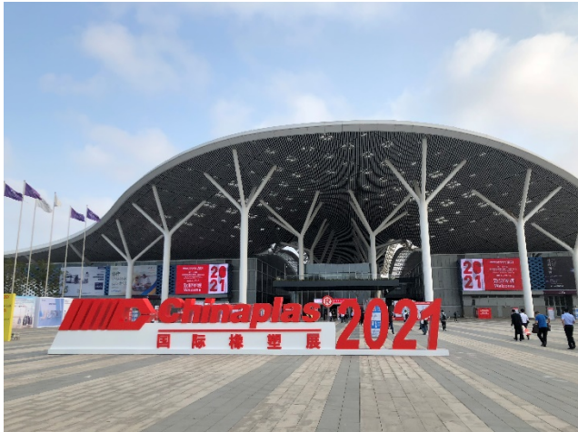
Pic-6: Die Chinaplas ist die erste große Veranstaltung in 2021 mit mehr als 152.000 Besuchern.